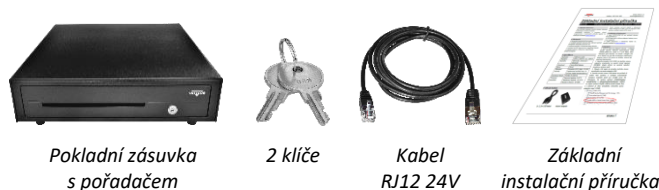
Pokladní zásuvka s pořadačem