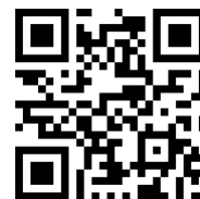
QR kód obsahující znaky ěščřžýáé

Načtením následujícího QR kódu si to můžete vyzkoušet: