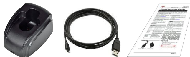
Dobíjecí základna s Bluetooth modulem