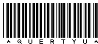
* Q U E R T Y U *