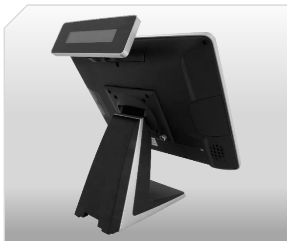
Integrovaný zákaznický displej 2 x 20 znaků