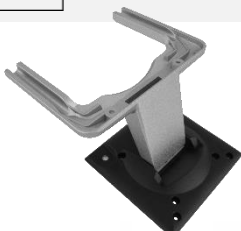
VESA držák 2. monitoru