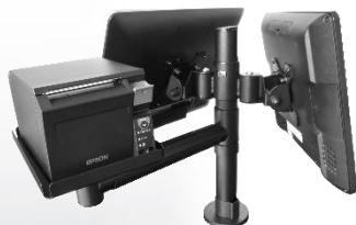
Instalace na tiskovém držáku