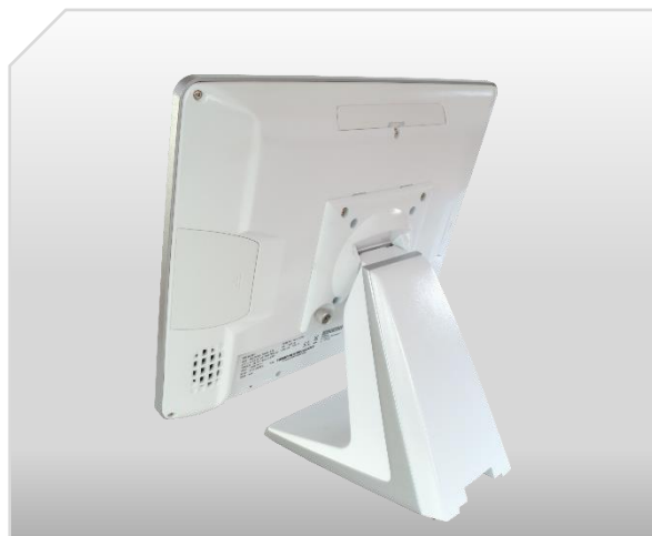
Elegantní provedení v bílé barvě