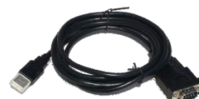
USB – RS232 redukce HAC0024