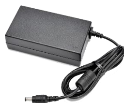
volitelný externí zdroj EAPOSA9205