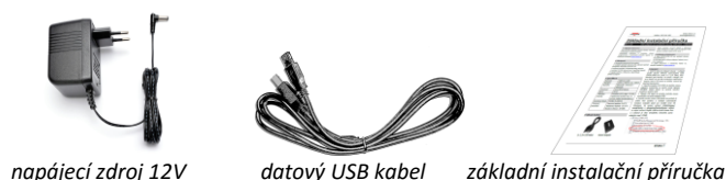
napájecí zdroj 12V