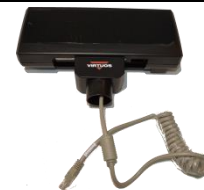
hlava displeje s kabelem

Celý displej se skládá z několika částí. Hlavní je hlava displeje s vlastním zobrazovačem, polohovacím kloubem a připojeným plochým kabelem ukončeným konektorem RJ-45. Další částí je základna displeje, která obsahuje převodník USB na sériový port a připojovací konektory. Mezi hlavu a základnu se vkládají dle potřeby propojovací trubky. Je tak možno mít displej nízký bez trubek o výšce 208 mm, s jednou trubkou 358 mm a s oběma 508 mm. Poslední částí je kabel USB typu A-B o délce 2 m pro připojení k POS systému, počítači, tabletu (OTG mode...).