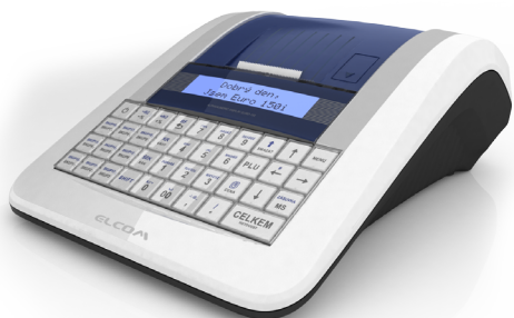
Euro-150TEi Flexy CZ