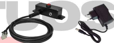
Tlačítko s kabelem