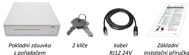
Pokladní zásuvka s pořadačem