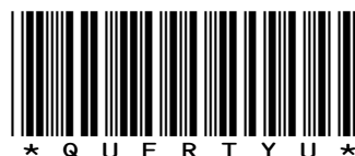
* Q U E R T Y U *