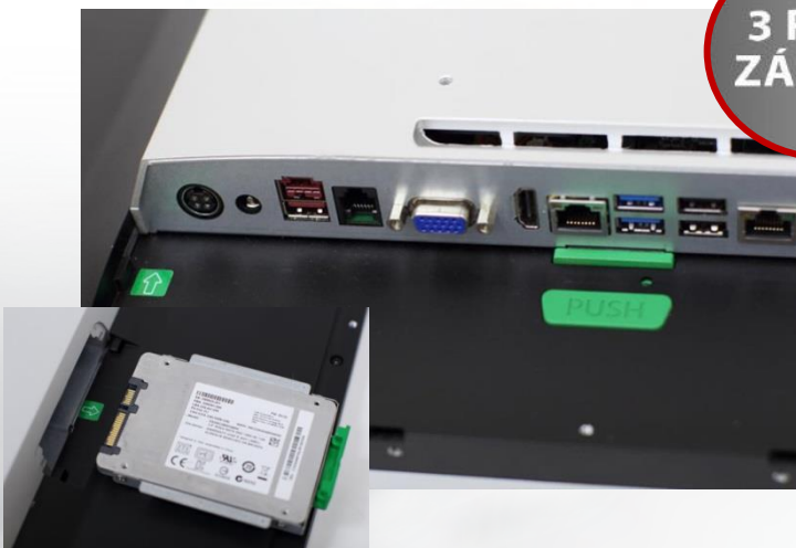
Výměnný pevný disk i celý systémový modul