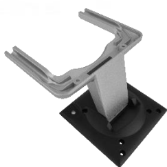
VESA držák 2. monitoru