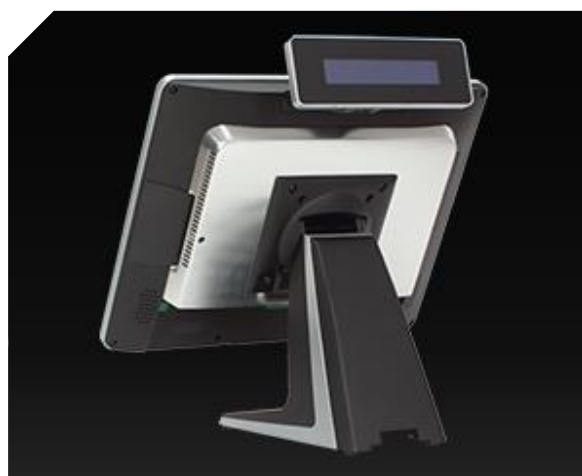
Integrovaný zákaznický displej 2 x 20 znaků