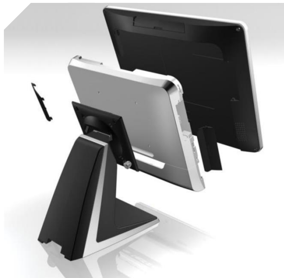
Výměnný systémový modul