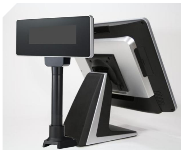
Držák externího zákaznického displeje