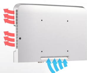
Účinný odvod tepla