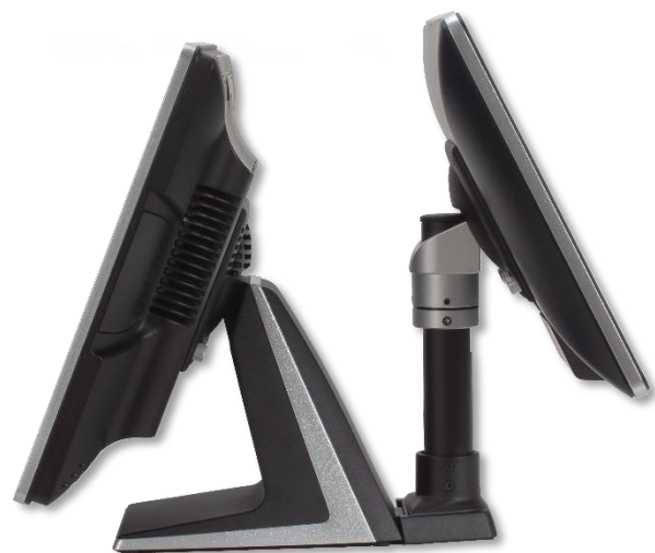
Vyobrazení s držákem AerPole a externím LCD