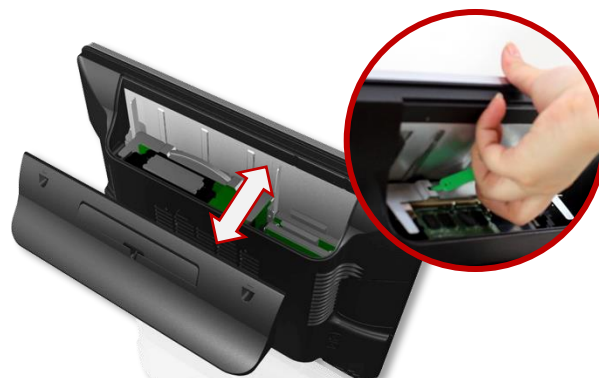
Kryt systémového modulu